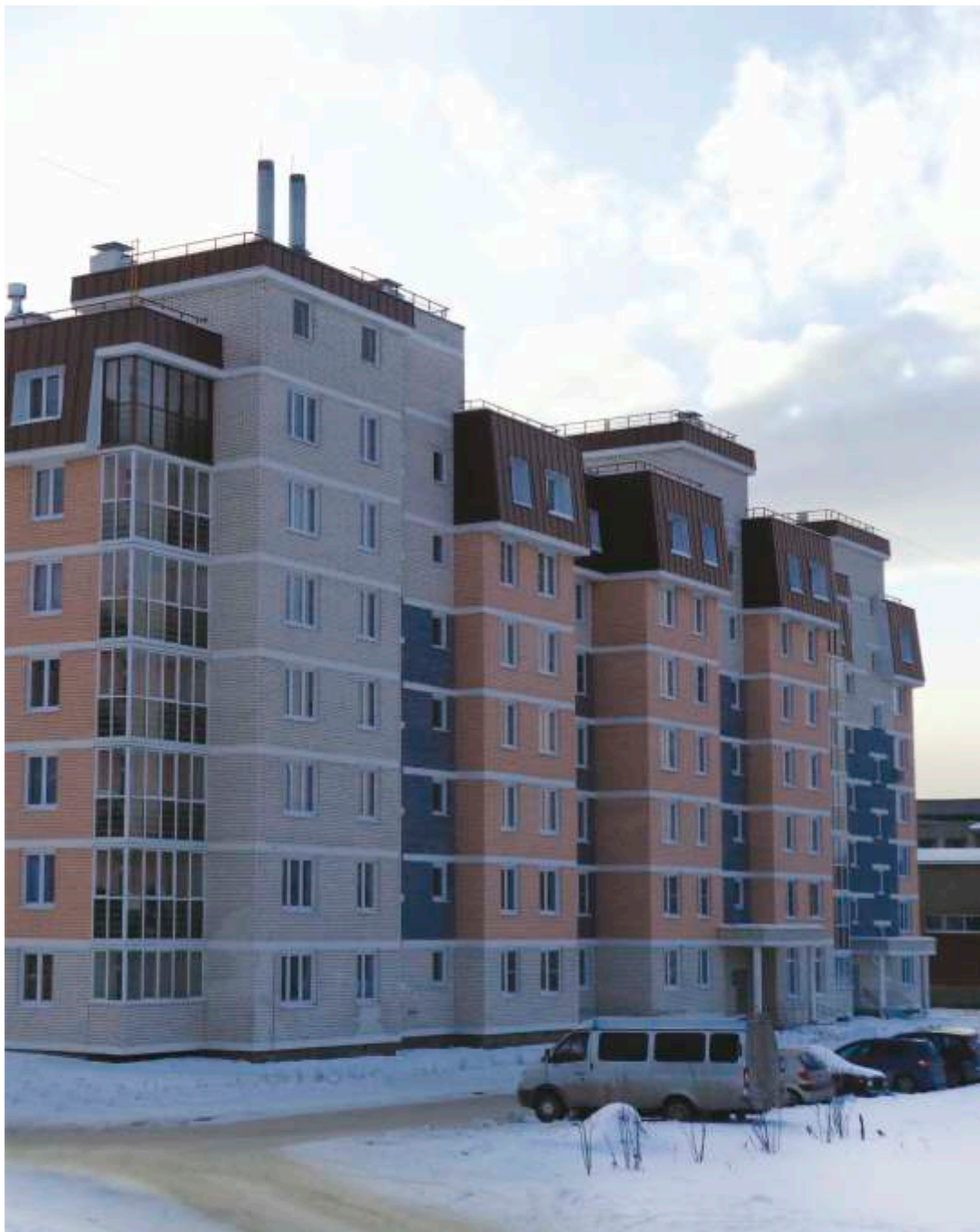
Среднеуральск (Свердловская область)