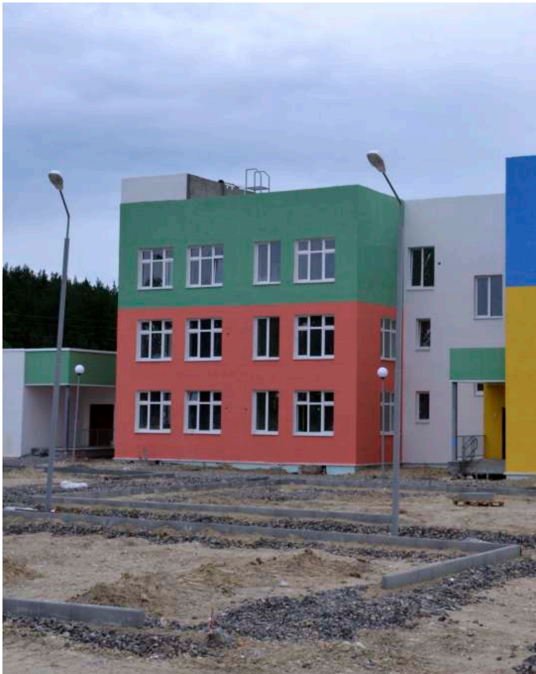
с. Обуховское, Камышловский р-н (Свердловская область)