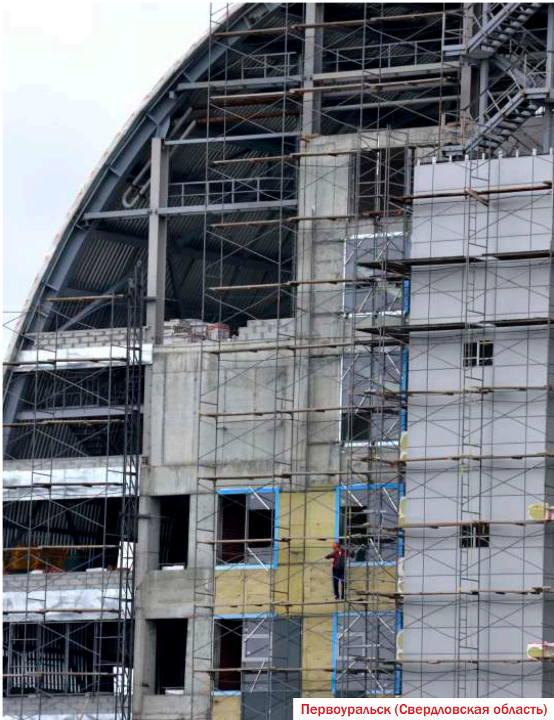
Первоуральск (Свердловская область)

Название объекта: Дом Новой Культуры (ДНК-центр)