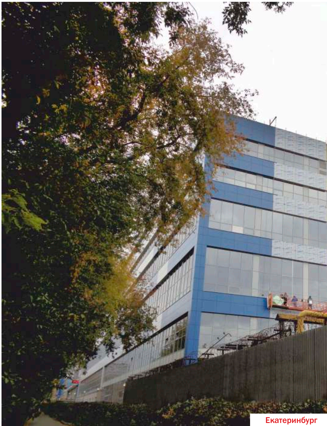
Название объекта: АО «УПП «Вектор»